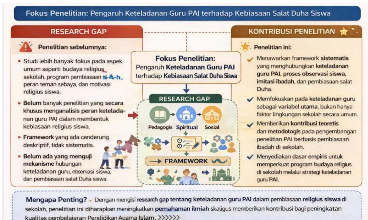
Gambar 2. Mengisi Kesenjangan (Research Gap) dan Membawa Kontribusi dalam Penelitian Pendidikan Agama Islam

Pada konteks Pendidikan Agama Islam, seorang peneliti pertama-tama perlu menelaah penelitian-penelitian terdahulu seputar tema yang sama atau mirip. Setelah itu, ia baru dapat menyusun framework penelitian PAI. Pada tema salat Duha siswa, misalnya ditemukan fokus penelitian sebelumnya pada program pembiasaan sekolah yang tidak spesifik ditekankan pada peran guru PAI, pengaruh teman karib yang bersikap religious, peran guru secara umum dalam pelaksanaan salat Duha siswa yang tidak spesifik pada peran guru PAI juga.