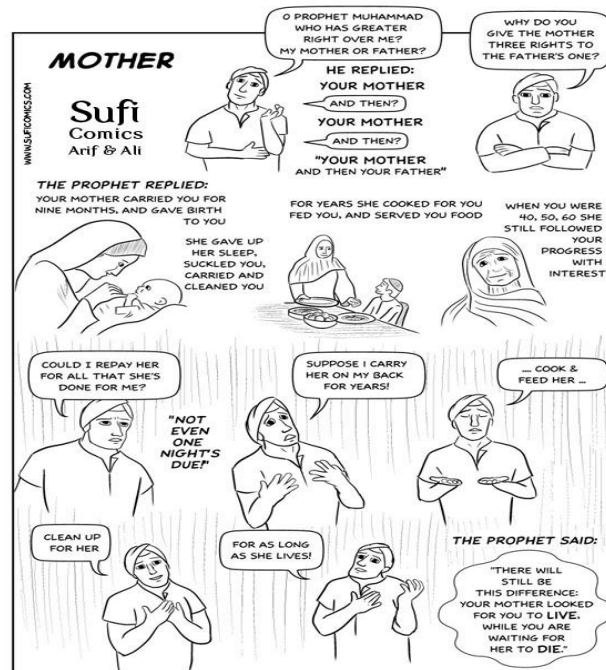
Gambar 2. Web Comic berjudul "Mother"

Setting atau lokasi penelitian ini adalah di Universitas Ibrahimy Situbondo, jurusan tarbiyah, program studi tadaris bahasa Inggris semester 2, dengan jumlah 32 siswa. Mata kuliah Reading I, semester genap tahun pelajaran 2017/2018. Subyek penelitian dalam penelitian ini adalah dosen mata kuliah Reading I di Universitas Ibrahimy Situbondo.