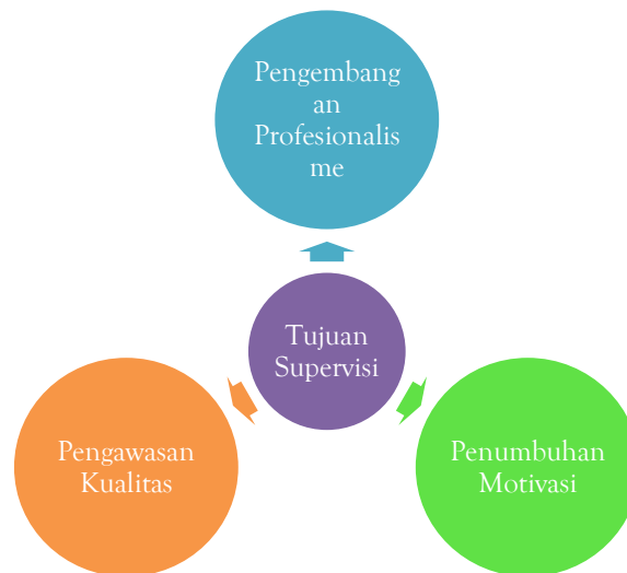
Gambar 1: Tujuan Supervisi Akademik

Berdasarkan gambar di atas jelaslah bahwa inti dari tujuan supervisi akademik fokus pada guru, yaitu untuk pengembangan profesionalisme guru dalam memahami akademiknya, kehidupan kelas dan keterampilannya dalam melaksanakan proses pembelajaran, pengawasan, dan menumbuhkan motivasi bagi guru yang bersangkutan. Dengan uraian di atas, dapat dikatakan bahwa dengan supervisi akademik guru akan semakin memiliki kemampuan untuk melaksanakan pembelajaran yang efektif, dan berdampak pada peningkatan prestasi belajar siswa.