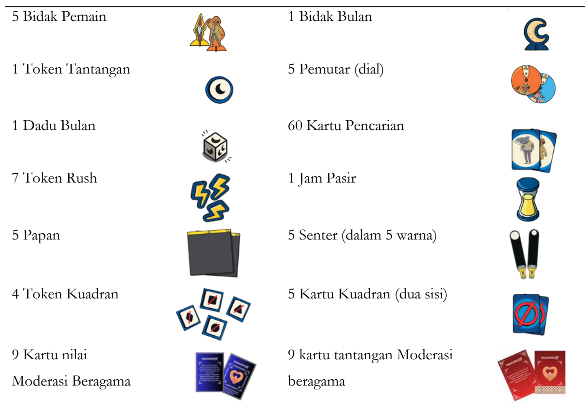
Tabel 1. Komponen Permainan

Berdasarkan dari sisi desain visual, boardgame ini menggunakan pendekatan ilustrasi yang inklusif dengan menampilkan karakter yang merepresentasikan keberagaman latar belakang agama dan budaya. Hal ini bertujuan untuk menciptakan rasa keterwakilan ( sense of belonging ) bagi peserta. Sementara itu, dari sisi mekanika permainan, sistem dirancang dalam bentuk: (1) mode kooperatif (menekankan kerja sama); dan (2) mode kompetitif (meningkatkan motivasi bermain).