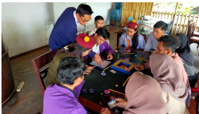
Gambar 6. Mengajarkan teknik refleksi agar nilai-nilai moderasi beragama dapat diinternalisasikan peserta.

Setelah permainan selesai, kegiatan dilanjutkan dengan sesi refleksi bersama. Peserta diminta untuk mengaitkan pengalaman bermain dengan nilai-nilai moderasi beragama dalam kehidupan nyata.