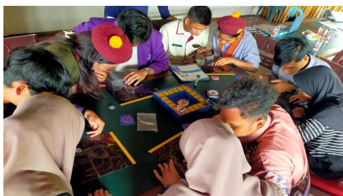
Gambar 3. Uji coba terbatas

Setelah prototipe selesai dikembangkan, dilakukan uji coba terbatas kepada 10 peserta pemuda lintas iman untuk mengukur efektivitas awal dari boardgame. Uji coba ini bertujuan untuk menilai: (1) Keterbacaan dan pemahaman aturan permainan; (2) Kesesuaian konten dengan realitas peserta; dan (3) Daya tarik visual dan mekanika permainan.