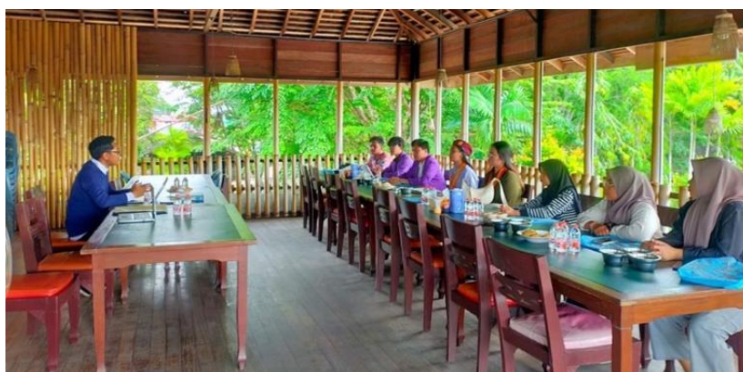
Gambar 4. Membekali fasilitator dengan pemahaman tentang konsep dasar moderasi beragama.

Pada sesi awal, fasilitator menyampaikan pengantar mengenai moderasi beragama serta sembilan kata kunci yang menjadi dasar permainan. Sesi ini berlangsung secara interaktif dengan melibatkan peserta dalam diskusi ringan.