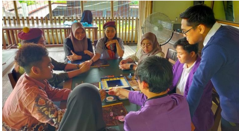
Gambar 5. Memberikan keterampilan praktis dalam memandu jalannya permainan boardgame .

Tidak ditemukan dominasi individu, seluruh peserta memiliki kesempatan yang sama untuk berkontribusi.