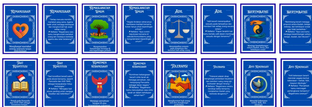
Gambar 2. Kartu 9 Kata Kunci Moderasi Beragama

Nilai ini menekankan pentingnya menerima dan menghargai tradisi lokal sebagai bagian dari identitas sosial. Hasil identifikasi menunjukkan bahwa tradisi dapat menjadi ruang temu lintas iman yang efektif, terutama melalui kegiatan budaya dan seni.