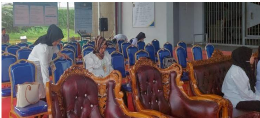
Gambar 4. Persiapan Pemberian Materi

Narasumber utama menyiapkan materi presentasi dalam bentuk slide PowerPoint yang berisi penjelasan mengenai hak-hak narapidana perempuan, dilengkapi dengan ilustrasi kasus nyata agar materi lebih mudah dipahami oleh peserta. Penggunaan media visual dan contoh kasus membantu peserta menghubungkan materi hukum dengan pengalaman yang mereka hadapi sehari-hari di lingkungan lembaga pemasyarakatan.