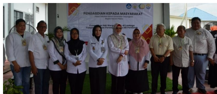
Gambar 9. Foto Bersama

Kegiatan diakhiri dengan sesi foto bersama antara tim PKM, pejabat Lapas, petugas, dan peserta. Foto ini menggambarkan suasana kekeluargaan, semangat kolaborasi, dan komitmen untuk bersama-sama mewujudkan Lapas Ramah Ibu dan Anak. Dokumentasi ini menjadi bukti nyata bahwa kegiatan akademik dapat berkontribusi langsung pada peningkatan kualitas layanan di institusi pemasyarakatan.