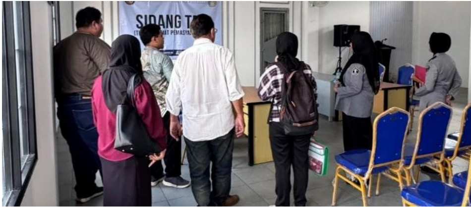
Gambar 3. Pengecekan Lapangan Untuk Pengabdian Kepada Masyarakat

Survei ini tidak hanya menghasilkan data, tetapi juga menjadi momen membangun komunikasi dan kepercayaan antara tim akademik dan pihak Lapas. Kepala Lapas bersama jajarannya menyambut baik kegiatan ini dan menyatakan komitmen mendukung jalannya program. Tim PKM juga memperoleh informasi penting terkait profil narapidana hamil dan menyusui, termasuk usia kehamilan, kondisi kesehatan, serta dukungan gizi yang diberikan. Informasi ini membantu narasumber menyesuaikan bahasa penyampaian materi agar mudah dipahami peserta, sekaligus menyentuh aspek yang paling relevan dengan kebutuhan mereka.