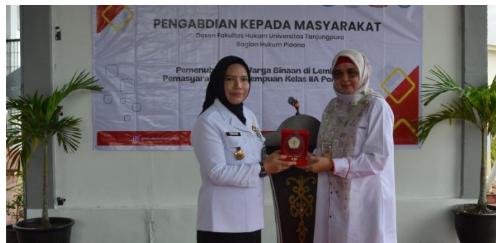
Gambar 8. Pemberian Plakat dan Apresiasi kepada Lapas Perempuan Kelas II Pontianak

Pada kesempatan tersebut, Kepala Lapas menyampaikan apresiasi terhadap pelaksanaan kegiatan yang dinilai memberikan manfaat bagi narapidana perempuan, terutama bagi mereka yang sedang hamil dan menyusui. Pihak Lapas juga menyampaikan harapan agar kegiatan serupa dapat dilaksanakan secara berkelanjutan sebagai bagian dari upaya meningkatkan pemahaman narapidana mengenai hak-hak dasar mereka, sekaligus memperkuat perhatian terhadap kelompok rentan di lingkungan lembaga pemasyarakatan.