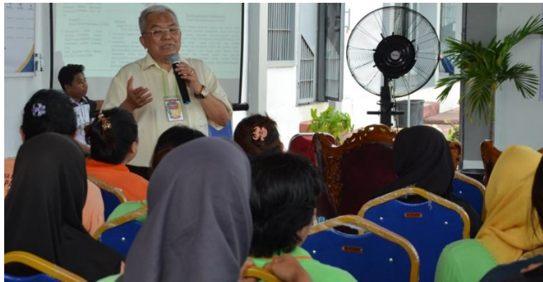
Gambar 6. Pemberian Materi oleh Narasumber Utama

Pemaparan materi dilengkapi dengan contoh kasus nyata dari beberapa Lapas lain di Indonesia yang telah mengembangkan program ramah ibu dan anak. Materi disampaikan dengan bahasa yang sederhana agar mudah dipahami oleh peserta, serta diselingi dengan pertanyaan ringan untuk mengukur pemahaman mereka terhadap materi yang diberikan. Pendekatan ini membantu menciptakan suasana diskusi yang lebih interaktif sehingga peserta tidak hanya mendengarkan, tetapi juga terlibat dalam proses pembelajaran. Selama sesi pemaparan dan diskusi berlangsung, tercatat sekitar 10–12 pertanyaan yang diajukan oleh peserta. Pertanyaan yang muncul umumnya berkaitan dengan prosedur memperoleh layanan kesehatan bagi ibu hamil di dalam Lapas, akses pemeriksaan kesehatan di luar Lapas apabila diperlukan, hak mendapatkan makanan tambahan bagi ibu hamil dan menyusui, serta mekanisme pengaduan apabila hak-hak kesehatan tidak terpenuhi.