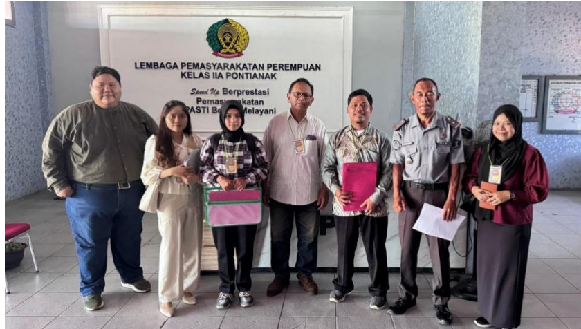
Gambar 2. Kegiatan survei awal di Lapas Perempuan Kelas IIA Pontianak

Pengumpulan data dilakukan melalui beberapa teknik, yaitu observasi langsung terhadap fasilitas layanan kesehatan di dalam lapas, wawancara singkat dengan petugas lapas yang menangani pelayanan kesehatan, serta diskusi awal dengan beberapa narapidana perempuan yang bersedia memberikan informasi mengenai pengalaman mereka dalam mengakses layanan kesehatan. Selain itu, tim juga menggunakan lembar checklist observasi untuk mencatat kondisi fasilitas pendukung seperti ruang pemeriksaan kesehatan, akses terhadap layanan antenatal, serta ketersediaan informasi mengenai hak kesehatan bagi narapidana perempuan.