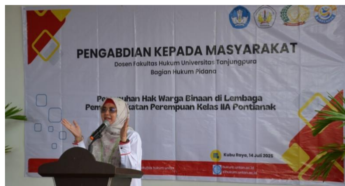
Gambar 7. Kata Sambutan dari Dekan Fakultas Hukum Universitas Tanjungpura

Sebagai bagian dari penutup kegiatan, tim PKM menyerahkan plakat kepada Kepala Lapas