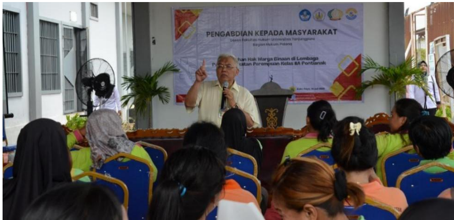
Gambar 5. Pemberian Materi Penyuluhan

Sesi utama diawali dengan sambutan Kepala Lapas yang menegaskan komitmen menjadikan Lapas Perempuan Kelas IIA Pontianak lebih ramah ibu dan anak. Ketua tim PKM kemudian menekankan pentingnya kolaborasi antara dunia akademik dan institusi pemasyarakatan dalam memastikan pemenuhan hak-hak narapidana.