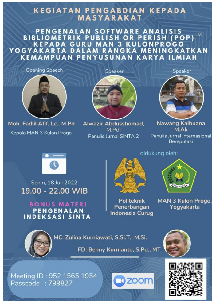
Gambar 1. Flyer Pelaksanaan Kegiatan PKM Pengenalan Publish or Perish

Sebelum acara dimulai pemateri memberikan Pre test kuesioner yang berisi pertanyaan kepada para guru di MAN 3 Kulonprogo Yogyakarta tentang Software Analisis Bibliometrik Publish or Perish (POP) yang bertujuan untuk mendapatkan informasi pengetahuan, kemampuan dan bakat terkait materi yang akan diajarkan. Hasil pretest akan membantu menggabungkan dari pengetahuan peserta didik sebelumnya dengan ilmu pengetahuan yang baru sehingga dapat disesuaikan kemampuan peserta didik dengan materi yang diajarkan 19 .