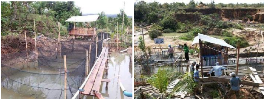
Gambar 4. Posisi kolong pada Pokdakan Menumbing Sejahtera yang lebih rendah dan rawan limasan air hujan.

Pokdakan Menumbing Sejahtera memanfaatkan kolong saat musim kemarau untuk kesinambungan produksi Ikan Lele. Kolam-kolam buatan sebagai kolam utama budidaya ikan mengalami kekeringan saat musim kemarau, sementara kolong yang memiliki kedalaman 1,5 – 5 meter masih menampung air sehingga masih dapat dimanfaatkan untuk budidaya ikan. Kendala pemanfaatan kolong saat musim penghujan akibat posisi kolong lebih rendah sehingga menjadi limpasan air hujan (Gambar 4). Pada saat sedemikian, terjadi kematian ikan yang tinggi jika dimanfaatkan untuk budidaya. Kematian ikan ini dimungkinkan akibat perubahan nilai pH air yang disebabkan masuknya air hujan dalam jumlah besar. Air kolong yang cenderung asam menjadi lebih asam dan tidak dapat ditolerir oleh ikan. Perairan kolong yang cenderung asam dengan karakteristik tanah Pulau Bangka yang juga asam, mempercepat penurunan kualitas air. Wardhani et al. (2015) menunjukkan bahwa hujan secara alami bersifat asam (pH 5,6) karena karbondioksida (CO 2 ) di udara dapat larut dalam air hujan dan menghasilkan senyawa yang bersifat asam. Sementara menurut Kurniawan dan Ardiansyah (2012), kolong di Pulau Bangka memiliki nilai pH antara 5 – 7 dengan pH tanah 4,7 – 4,8. Kurniawan (2012) menambahkan bahwa pH optimal untuk pertumbuhan ikan antara 6,5 – 8 dan nilai pH dibawah 5 menjadi batas kematian ikan dan udang.