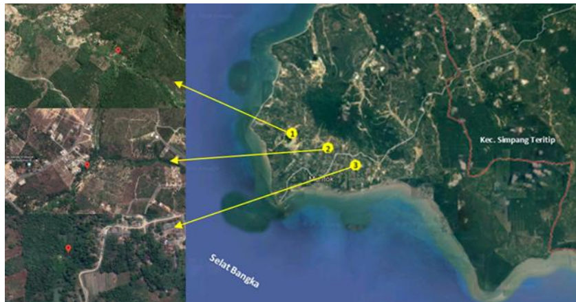
Gambar 2. Lokasi Pokdakan yang memanfaatkan kolong di Kecamatan Muntok : (1) Pokdakan Sirkel di Desa Air Putih, (2) Pokdakan Menumbing Sejahtera di Kelurahan Sungai Daeng, (3) Pokdakan Arung Hijau Harapan di Desa Belo Laut

Kajian tentang pemanfaatan kolong untuk budidaya ikan di Kecamatan Muntok, Kabupaten Bangka Barat bertujuan untuk mengetahui pemanfaatan kolong sebagai wadah budidaya ikan dengan permasalahan dan potensinya. Kajian ini dilaksanakan Bulan Juni - Juli 2018 dengan metode deskriptif kualitatif melalui proses wawancara secara langsung dan observasi pada tiga kelompok pembudidaya ikan (pokdakan) air tawar yang memanfaatkan perairan kolong pada pengumpulan datanya. Kelompok tersebut adalah Pokdakan Sirkel di Desa Air Putih, Pokdakan Menumbing Sejahtera di Kelurahan Sungai Daeng dan Pokdakan Arung Hijau Harapan di Desa Belo Laut (Lokasi pokdakan terdapat pada Gambar 2). Wawancara dilakukan pada saat anjungsana perorangan dan kelompok sebagai pelaksanaan tugas penyuluh perikanan. Data wawancara yang diperoleh dijelaskan secara deskriptif, kualitatif maupun kuantitatif sehingga dapat memberikan informasi yang tentang pemanfaatan perairan kolong sebagai media akuakultur.