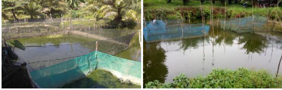
Gambar 3. Budidaya ikan sistem karamba jaring tancap pada Pokdakan Sirkel.

Pokdakan Menumbing Sejahtera memanfaatkan kolong saat musim kemarau untuk kesinambungan produksi Ikan Lele. Kolam-kolam buatan sebagai kolam utama budidaya ikan mengalami kekeringan saat musim kemarau, sementara kolong yang memiliki kedalaman 1,5 – 5 meter masih menampung air sehingga masih dapat dimanfaatkan untuk budidaya ikan. Kendala pemanfaatan kolong saat musim penghujan akibat posisi kolong lebih rendah sehingga menjadi limpasan air hujan (Gambar 4). Pada saat sedemikian, terjadi kematian ikan yang tinggi jika dimanfaatkan untuk budidaya. Kematian ikan ini dimungkinkan akibat perubahan nilai pH air yang disebabkan masuknya air hujan dalam jumlah besar. Air kolong yang cenderung asam menjadi lebih asam dan tidak dapat ditolerir oleh ikan. Perairan kolong yang cenderung asam dengan karakteristik tanah Pulau Bangka yang juga asam, mempercepat penurunan kualitas air. Wardhani et al. (2015) menunjukkan bahwa hujan secara alami bersifat asam (pH 5,6) karena karbondioksida (CO 2 ) di udara dapat larut dalam air hujan dan menghasilkan senyawa yang bersifat asam. Sementara menurut Kurniawan dan Ardiansyah (2012), kolong di Pulau Bangka memiliki nilai pH antara 5 – 7 dengan pH tanah 4,7 – 4,8. Kurniawan (2012) menambahkan bahwa pH optimal untuk pertumbuhan ikan antara 6,5 – 8 dan nilai pH dibawah 5 menjadi batas kematian ikan dan udang.