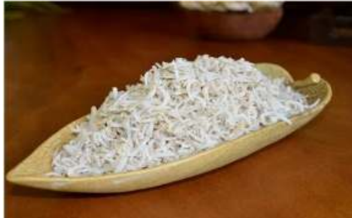
Gambar 1. Ikan Teri Nasi Segar

Pengadaan bahan baku teri segar diperoleh dari hasil tangkapan nelayan setempat yang biasanya mudah di dapatkan di tempat PPI Jangkar, Kabupaten Situbondo. Ikan teri segar yang baru diperoleh dari nelayan segera ditimbang untuk mengetahui berat awal bahan baku, kemudian dicuci bersih dengan air mengalir untuk disiapkan ke proses selanjutnya. Untuk mengetahui komposisi kimia awal ikan teri segar dilakukan analisa proksimat terhadap kandungan gizi ikan teri segar. Pada uji proksimat yang dijadikan tolak ukur uji adalah kadar protein, karbohidrat, lemak, kalsium, dan vitamin. Berikut tabel komposisi kimia ikan teri segar disajikan pada tabel dibawah ini: